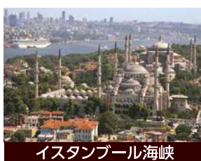
イスタンブール海峡