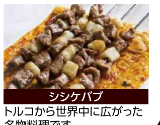
シシケパブ トルコから世界中に広がった名物料理です

📷 観光情報 【エフェソス】(所要約1時間30分) ★大劇場等を含むエフェソス遺跡(入場) 【パムッカレ】(所要約1時間) ★石灰棚(入場) ★ヒエラポリス遺跡(入場)