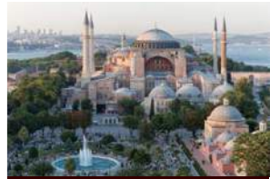
アヤソフィア寺院