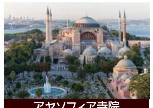
アヤソフィア寺院